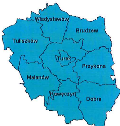
Rysunek 1: Podział administracyjny powiatu tureckiego